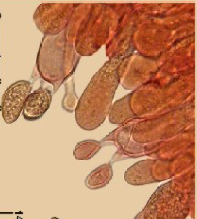
Conocybe pilosella (Pers.:Fr.) Kühner