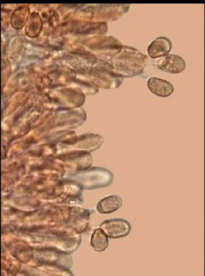
Tubaria furfuracea (Pers.:Fr.) Gillet

Spores: elliptiques présence de guttules 7.9 x 4 - 5,5 µm