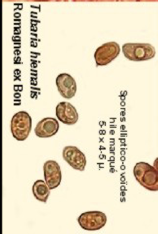
Spores elliptico-ovoides hile marqué 5-8 x 4-5 µ.