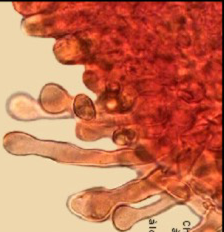
Chelocystides 35 à 75 µ. à apex arrondi 4 à 6 µ. flexueuse long col coudé 16 à 25 µ. base faiblement élargie 7 à 9 µ.